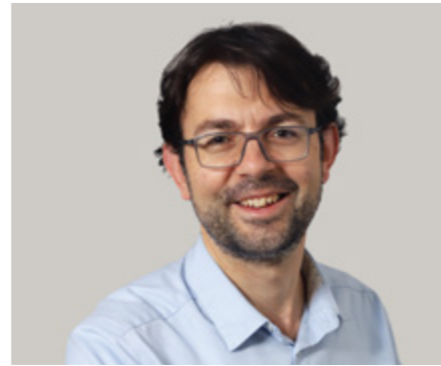
Docteur Frédéric Villebrun Président de l'USMCS

Nous le disions au dernier congrès des centres de santé en 2022, il est urgent de reconstruire le système de santé dans le cadre d'une politique de santé publique ambitieuse.